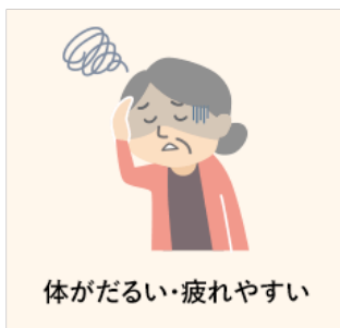
体がだるい・疲れやすい